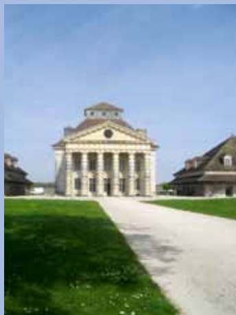
La Saline royale

Ce lieu était important avant parce qu'on faisait du sel. C'est un espace en demi-cercle.