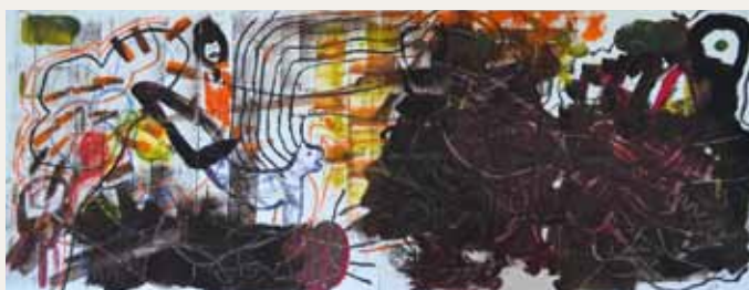
Travaux réalisés à la Saline royale par les élèves du CNED et de Juralternance