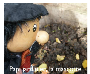
Papi jardinier, la mascotte

Au cœur de la situation d'apprentissage proposée ici aux élèves : l'étude de la langue, plus particulièrement la pratique du langage oral et les compétences transversales acquises ou à acquérir, compétences lexicales (connaître et réinvestir des mots nouveaux), compétences syntaxiques (faire des phrases structurées, reconnaître et utiliser la forme interrogative pour poser des questions ...), compétences en communication (écouter, s'écouter, s'exprimer pour se faire comprendre ...).