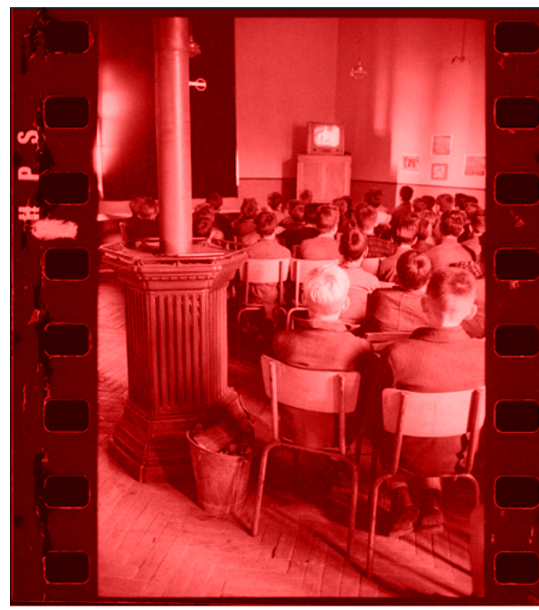
Fonds photographique IPN : Cahier n°4, reportage photographique n°4358 : négatifs. Télévision scolaire Liévin (pays minier) octobre 1961.

Pour tout renseignement, contacter : mne-contact@reseau-canope.fr